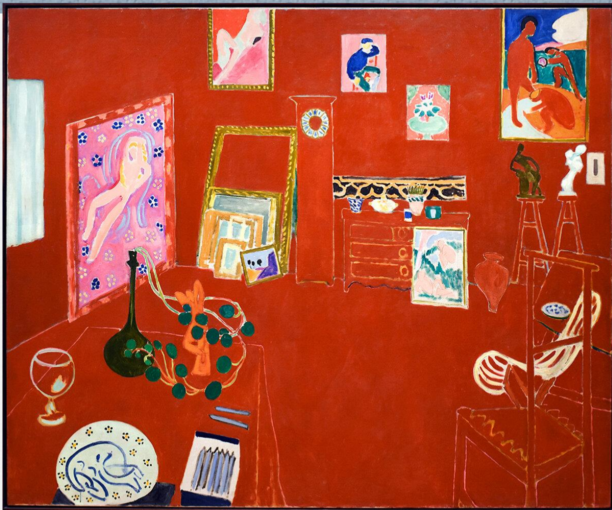
Анри Матисс «Красная студия» 1911г.