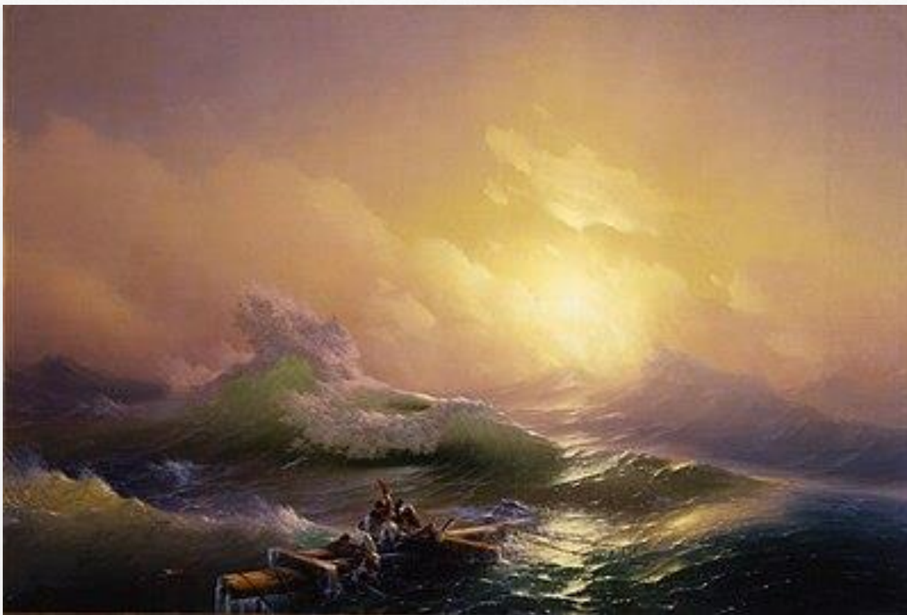
Айвазовский И. «Девятый вал» 1850г.