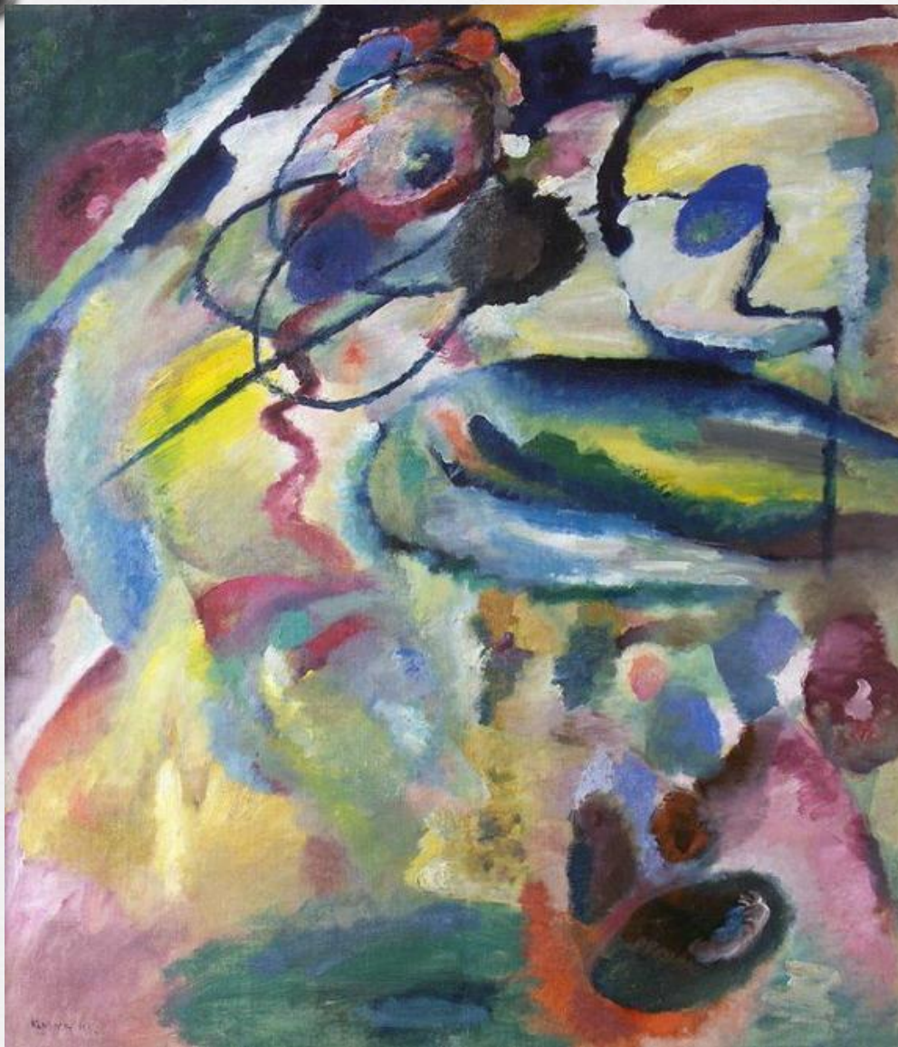
Василий Кандински й «Картина с кругом» 1911г.