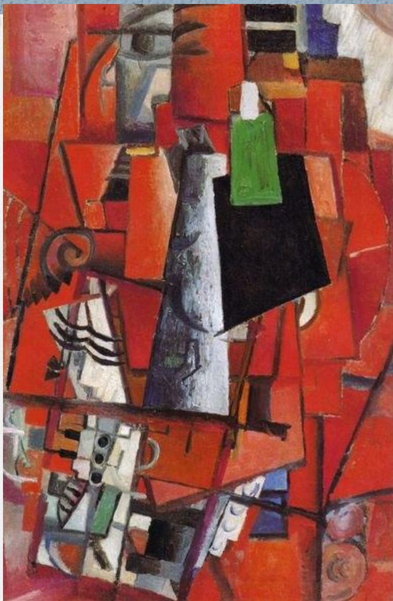
Казимир Малевич «Дама и рояль» 1913г.