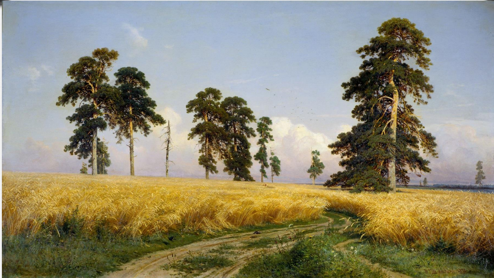
Шишкин И.И. «Рожь» 1878г.