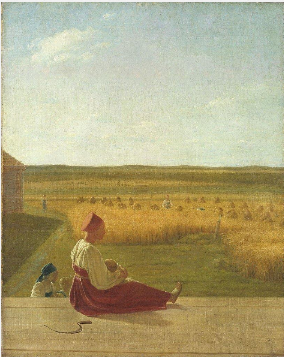
Венецианов А.Г. «На жатве. Лето» 1820г.