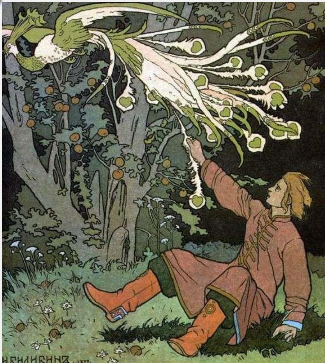
И. Я. Билибин «Иван-Царевич и жар птица» 1899г.