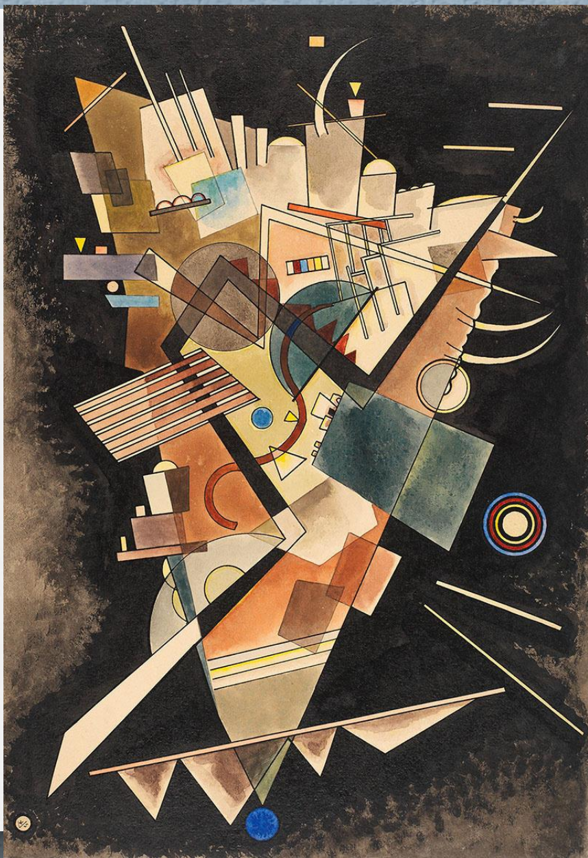
Василий Кандинский «Тяжелые плавающие» 1924г.