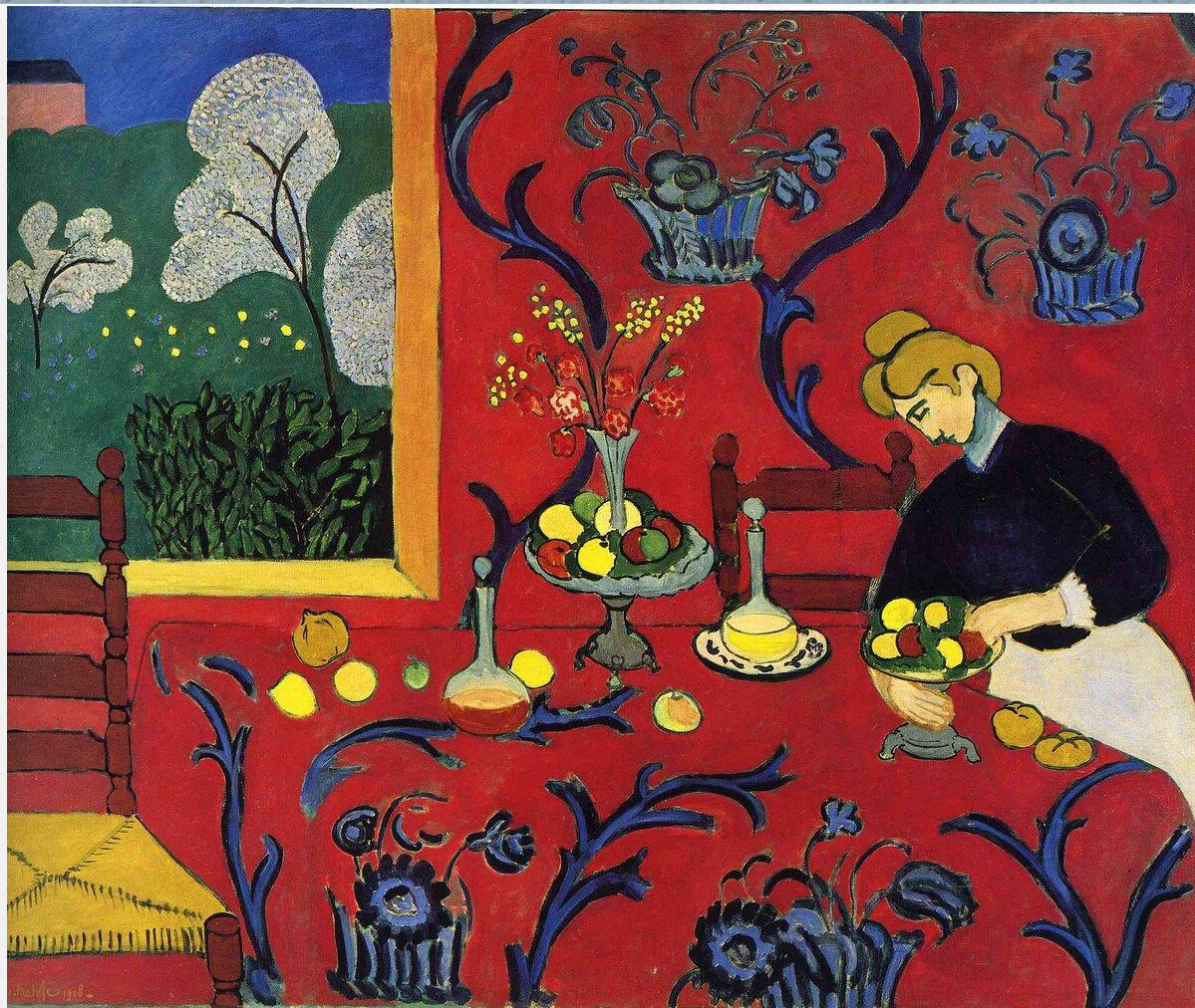
Анри Матисс «Десерт: Гармония в Красном» 1908г.